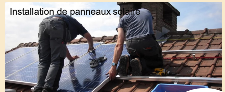
Installation de panneaux solaires

Avant tout projet, il est nécessaire de se renseigner auprès de la mairie. Ne prenez pas le risque d'engager des travaux sans autorisation.