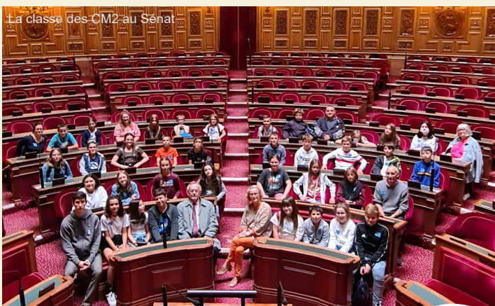
La classe des CM2 au Sénat

Les fiches de renseignements 2022-2023 transmises par le biais des écoles sont à rapporter en mairie ou au centre de loisirs corrigées, complétées et signées dans les meilleurs délais .