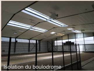
Isolation du boulodrome